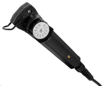
Control remoto tradicional MMA 3 para la regulación del amperaje