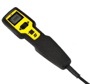
Control remoto multifuncional ER 1 con pantalla integrada