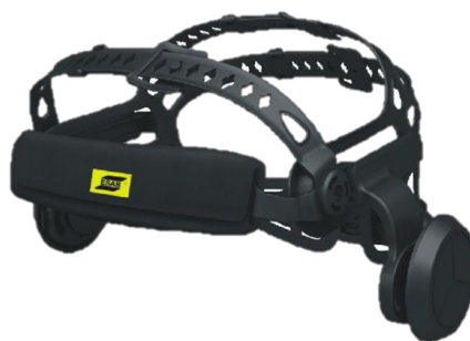
Cómodo arnés Halo™ de 5 puntos (vista frontal)

Visite esab.com para obtener más información.