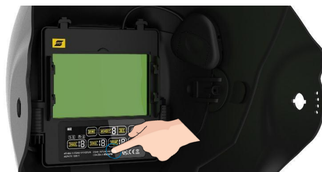
Tecnología ADF de alta clase óptica, con interfaz de pantalla táctil a color